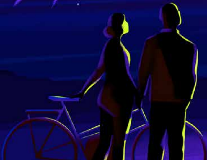
Illustration: Simone Noronha

Gute Vorsätze gehören nicht an den Anfang des Jahres, in die kalte Winterzeit, sondern in den frühen Herbst, davon ist Freundin-Autorin Ulrike Schädlich überzeugt. Wieso? Jetzt haben sie viel mehr Aussicht auf Erfolg!